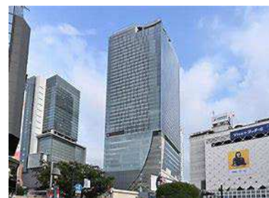
渋谷スクランブルスクエア

靴の歴史展示+靴のファッション史+お手入れ体験+学生作品展+ワークショップなどで構成する総合イベント