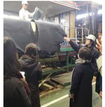
工場内を実際に歩き回り、各工程を見学しました。